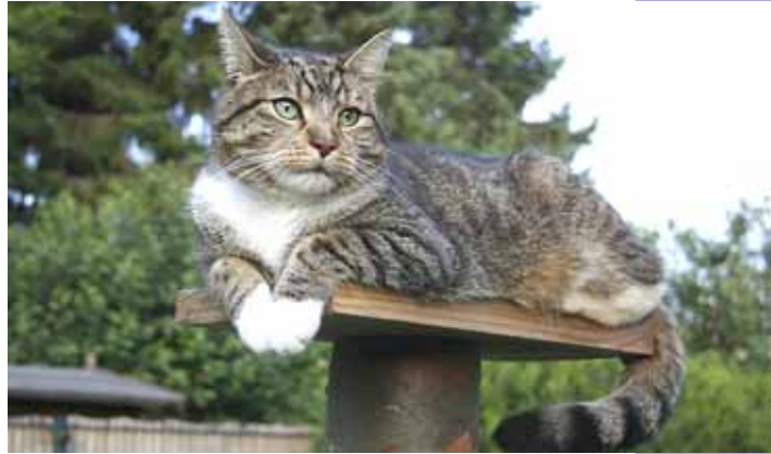
Kater Elvis vermisst die Mäuse.

Es ist wie verhext: seit Tagen habe ich keine einzige Maus gefangen! Okay, mein Revier beschränkt sich zwar nur auf unseren Garten, aber in den vergangenen Monaten hat sich regelmäßig ein kleines dummes Nagetier im Garten verirrt. Doch jetzt ist kein einziges weit und breit zu sehen! Sollten die winzigen Gesellen dazu gelernt haben? Sind sie intelligenter geworden oder haben sie sich gar abgesprochen? Ich weiß es nicht.