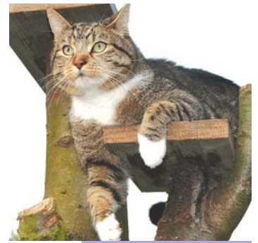
Kater Elvis im Jagdfieber

Phase 5: Ahnungslos kommt Frauchen in die Küche. Doch zu spät. Höchst zufrieden und gesättigt liege ich auf der Couch . . . So liebe ich die Jagd!