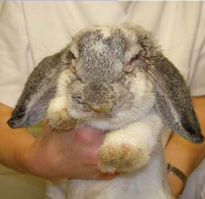
Ein Kaninchen, das an Myxomatose erkrankt ist.